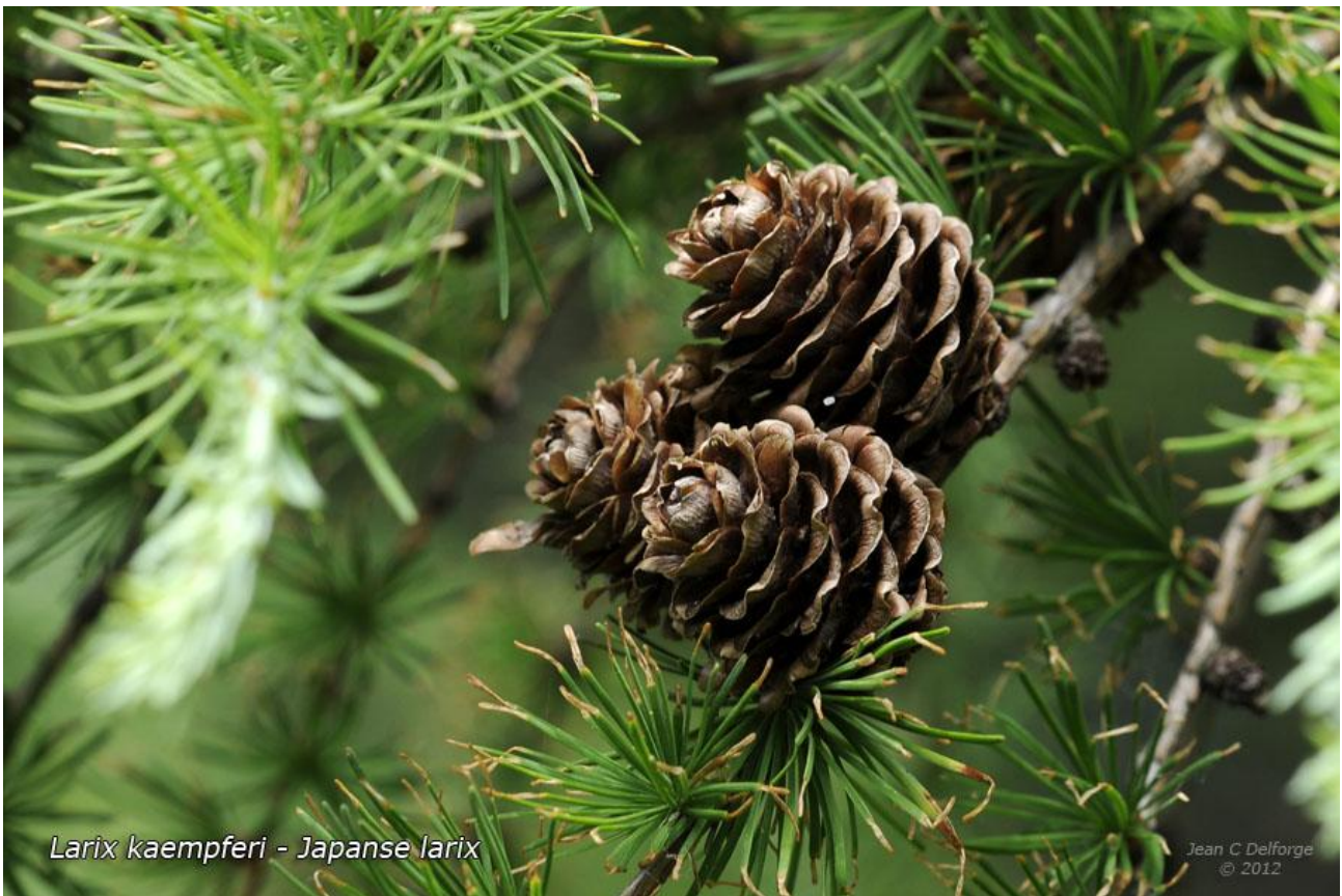
Larix kaempferi - Japanese larch