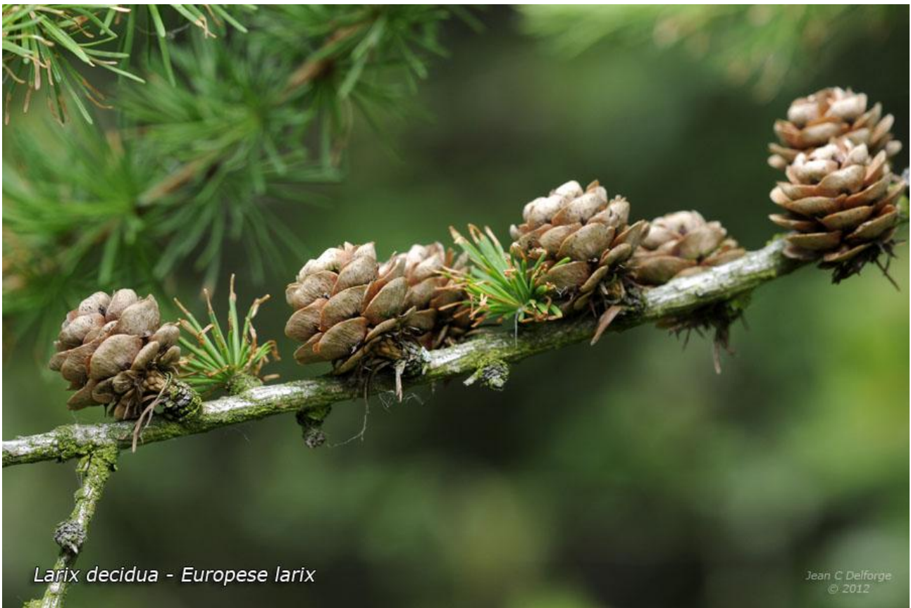
Larix decidua - European larch